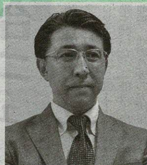
リニューアル技術開発協会