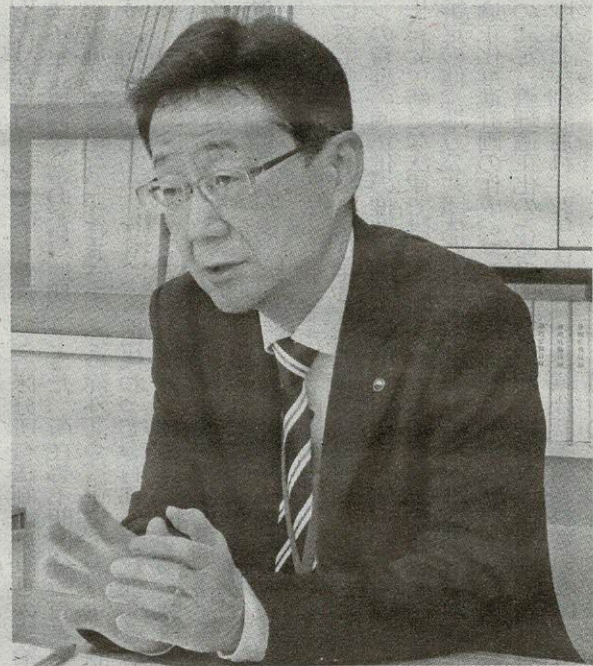
静岡県くらし・環境部建築住宅局